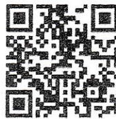
Web 視聴申込 URL